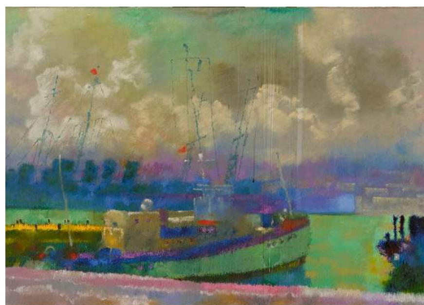
Sorgfältig gesammelte Dokumente: Augusto Giacometti 1943 beim Malen einer Ansicht von Stampa (Mitte) sowie das Bildnis von 1929 aus Zürich (oben links), die «Pantöffeli» von 1925 aus Chur (rechts) sowie «Le port d'Alger» von 1932 aus Paris.